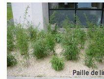
Paille de lin

Ou paillages commercialisés (écorces de pin, cosses de sarrasin, paille de chanvre...)