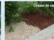
Cosses de cacao